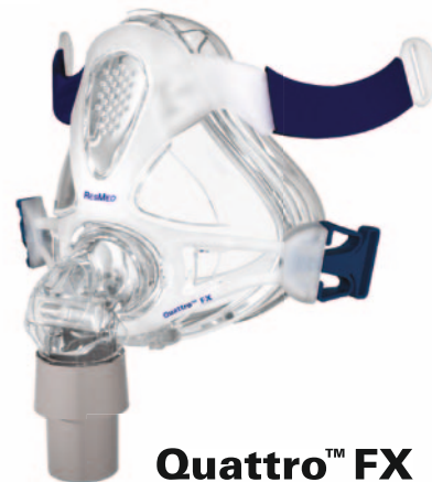
Quattro™ FX FULL FACE MASKE

Das hochmoderne Spring Air-Maskenkissen verteilt den Maskendruck gleichmäßig und verhindert unerwünschte, äußere Einflüsse. Quattro FX sitzt so sicher und komfortabel, dass Sie gut schlafen werden.